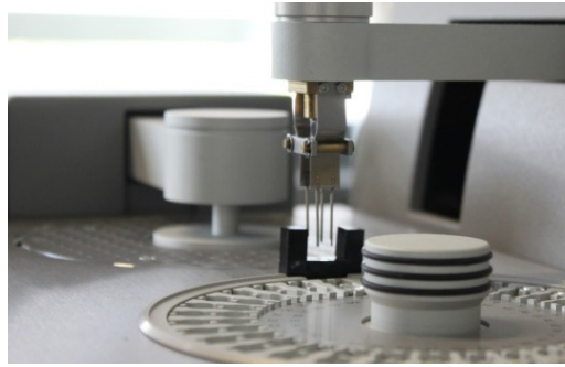
Standardisierung der Faservolumenbestimmung (FVG) mittels der Thermogravimetrischen Analyse (TGA)